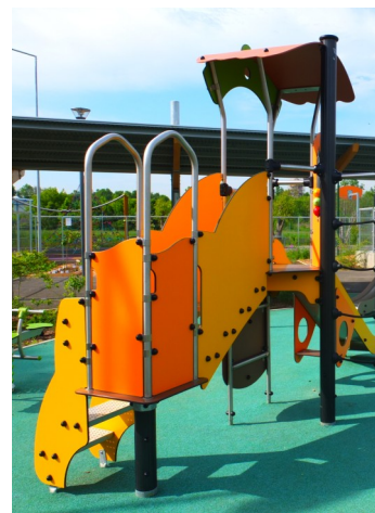
Les jeux extérieurs du primaire

Ces derniers ont largement contribué - entre autres - à équiper les deux centres de documentations du lycée : la BCD du primaire, et le 3C du secondaire.