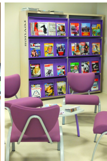
Le 3C du secondaire