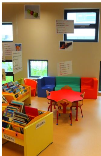
La BCD du primaire